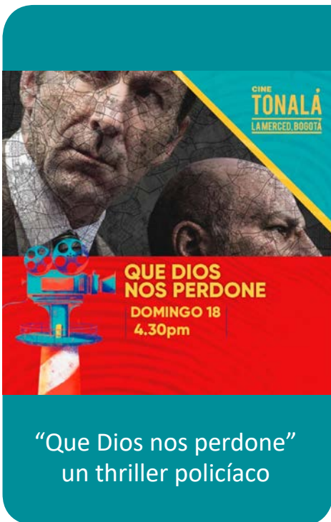
“Que Dios nos perdone” un thriller policíaco