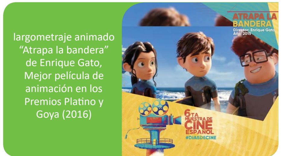
largometraje animado “Atrapa la bandera” de Enrique Gato, Mejor película de animación en los Premios Platino y Goya (2016)

Por otro lado, este año y como resultado de la creciente importancia del cine de animación español, que en los últimos años se ha posicionado como uno de los de mayor éxito en todo el mundo, estuvo una selección de películas animadas en distintas técnicas que grandes y chicos disfrutaron.