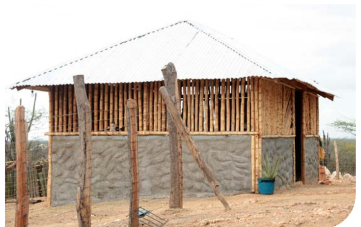
Ranchería de la comunidad MAI I, municipio de Uribia, La Guajira.