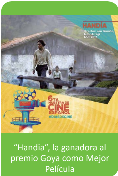
“Handia”, la ganadora al premio Goya como Mejor Película

E n 2018 se rinde homenaje al Festival Internacional de Cine de San Sebastián, uno de los eventos culturales y cinematográficos más importantes de España. De este modo, la sexta edición de la Muestra fue una gran oportunidad para ver las producciones españolas más representativas del Festival, que han tenido una enorme repercusión tanto a nivel nacional como internacional. Entre ellas encontramos Handia, galardonada como mejor película vasca en 2017 en el Festival y ganadora de diez premios Goya; la inquietante Que Dios nos perdone o la amable Truman, que nos enseña momentos de amistad y ética.