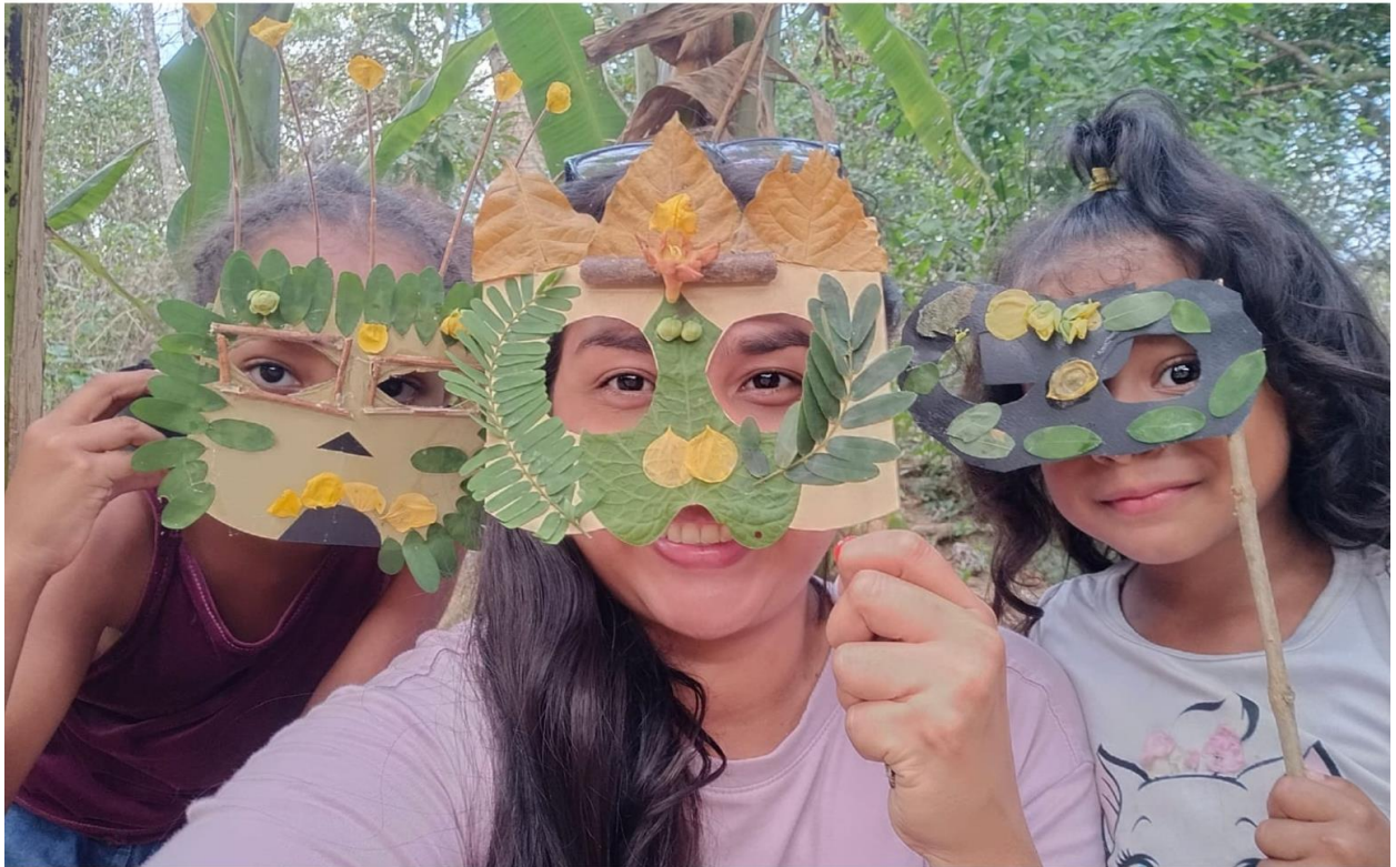
Figura 21. Registro 1, resultados del Taller Yo Naturaleza.