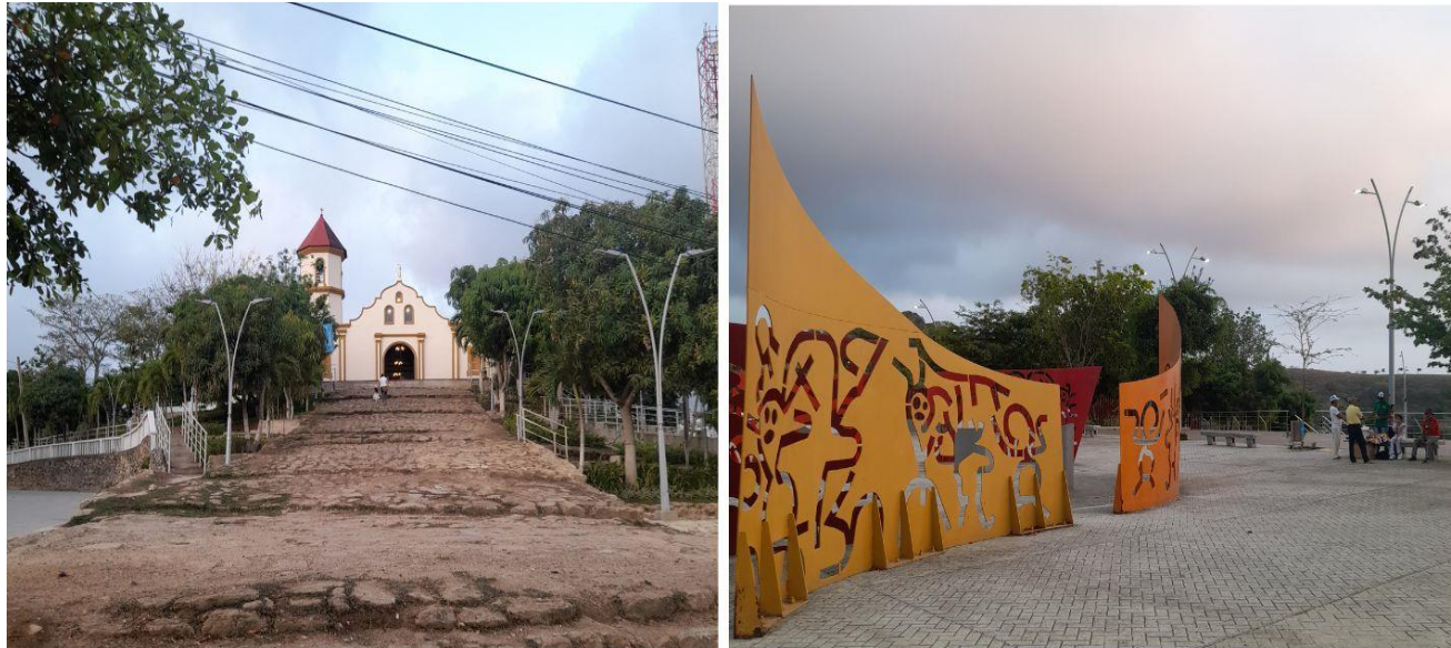
Figura 9. Registro, iglesia y plaza del municipio de Tubará.

Primero es importante conocer el territorio para entender su riqueza y así resaltar su relevancia y la urgencia que demanda la acción inmediata de prácticas culturales sanas en relación con él.