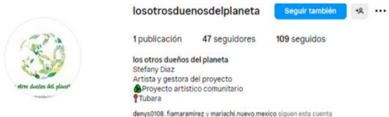
Figura 14. Portal Losotrosdueñosdelplaneta red

NOTA 2: Como parte del presente trabajo, hay un portal abierto en las redes sociales para la