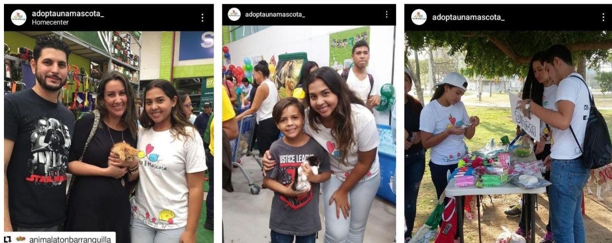
Registro 1. Registro, actividades con de la Fundación Adopta Una Mascota (2015).

A muy temprana edad comencé con la cría y el cuidado de animales domésticos en abandono, específicamente perros y gatos; de forma independiente me encargaba de sus atenciones y los acompañaba en el proceso de recuperación si poseían algún problema hasta su adopción. De esta forma fui adentrándome en las dinámicas de difusión y elaboración de actividades benéficas. En este mismo orden, en el año 2015 me encuentro con la Fundación Adopta Una Mascota, con la que desde el rol de voluntaria comienzo a participar activamente en sus actividades pro- fondos y jornadas de baño y alimentación a animales callejeros.