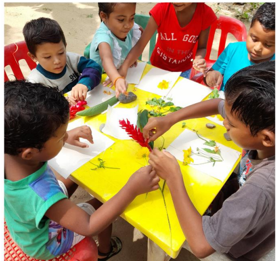
Figura 19. Registro gráfico 3, Taller Yo Naturaleza.