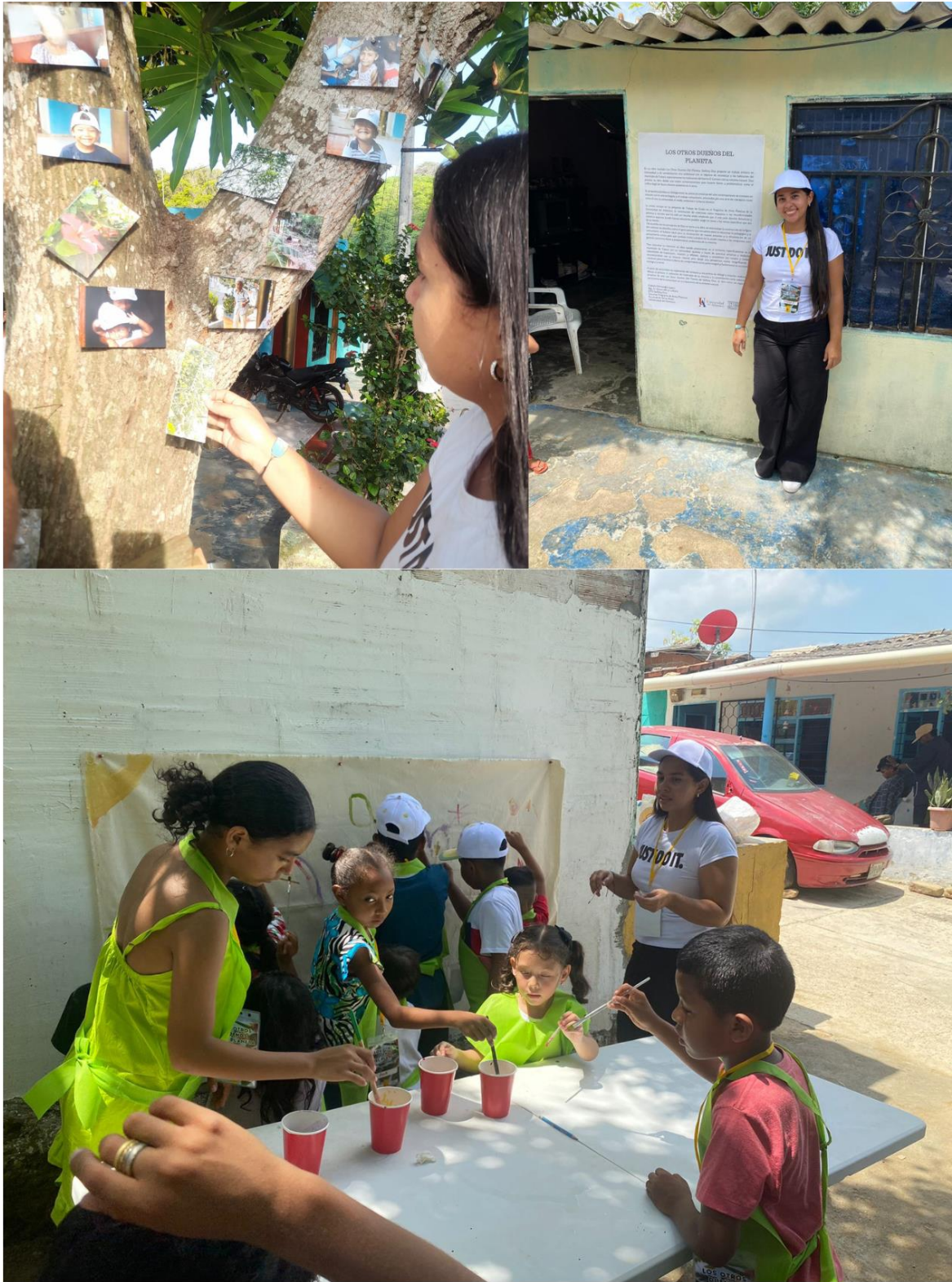
Figura 25. Registro 3, Día de la exposición