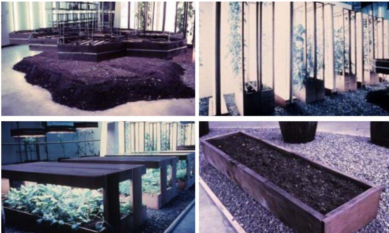
Figura 12. Full farm. Fuente: www.theharrisonstudio.net