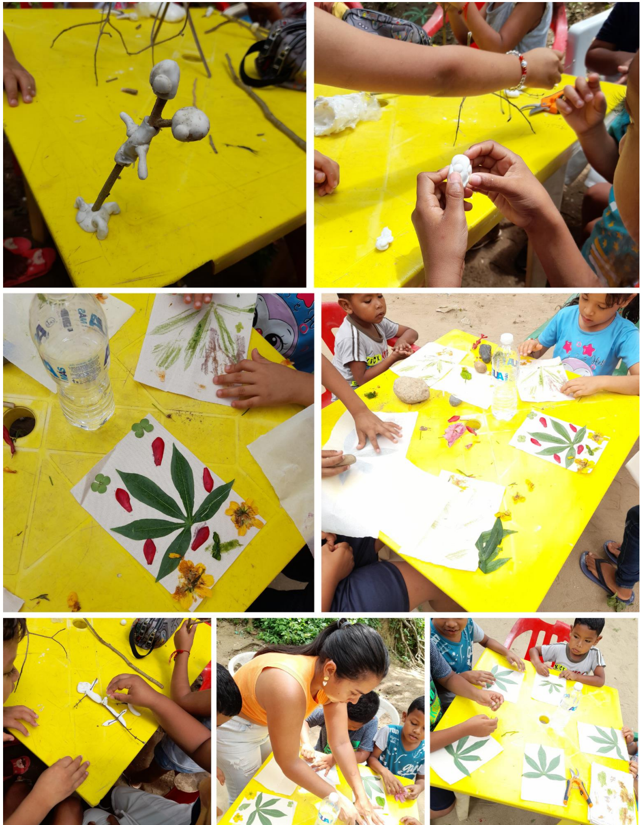
Figura 18. Registro gráfico 2, Taller Yo Naturaleza