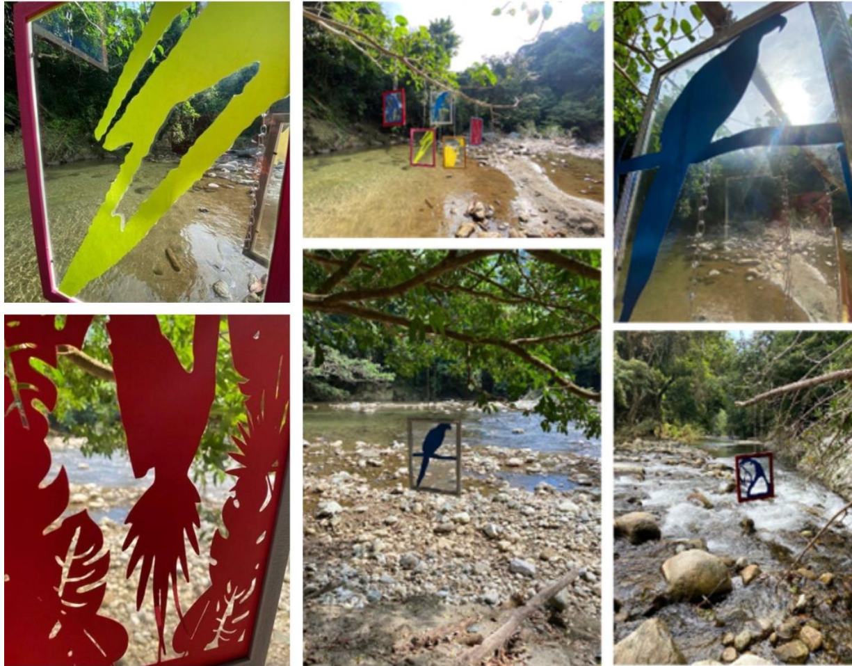
Figura 8. Registro, Avistamiento (2021).

En el año 2021 la propuesta titulada Avistamiento , fue una instalación ubicada en el área rural del municipio de Santa Rosalía en el departamento del Magdalena, donde se colocaron cinco piezas que enmarcaban la figura de las aves utilizando marcos tipo colgante, con el fin de que a través de las imágenes de las aves el espectador pudiera apreciar la majestuosidad de la naturaleza que nos rodea y de esta forma llevar un mensaje contra la tenencia de aves silvestres como mascotas. La intencionalidad de la obra era invitar al espectador a respetar la naturaleza y admirarla desde su libertad. Es latente en mis búsquedas como artista visibilizar y llevar de un modo íntimo a la reflexión de lo que hacemos como sociedad frente a una problemática que nos cuestiona como seres individualistas, respecto a los otros dueños del planeta; los animales.