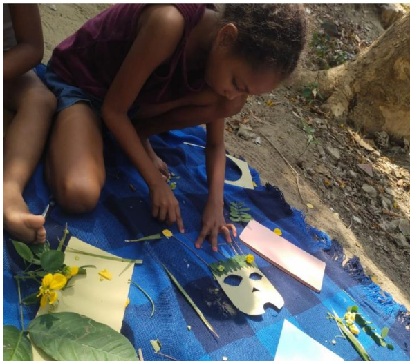
Figura 20. Registro del desarrollo de las actividades del taller.