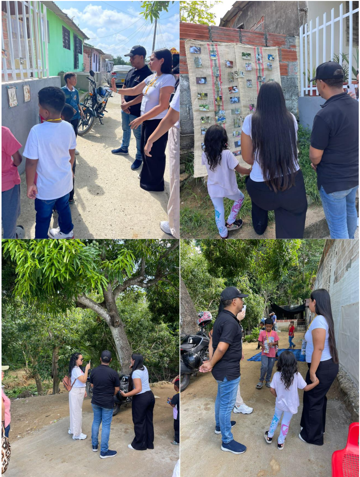
Figura 23. Registro 1, Día de la exposición