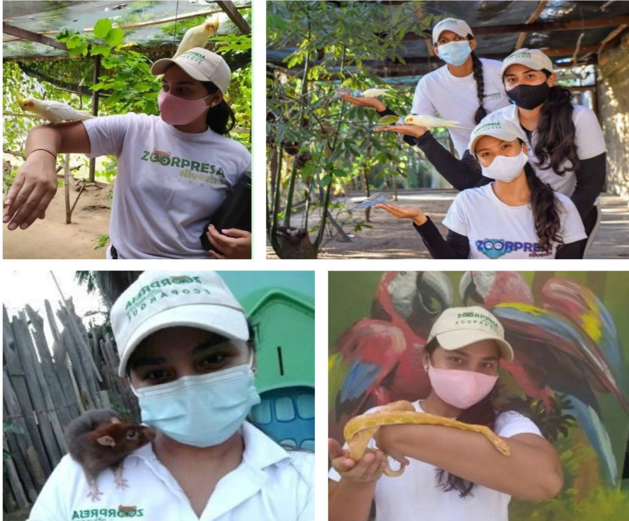
Figura 3. Registro Zoopresa Silvestre (2022).

Desde la práctica comienzo a entender mejor que los problemas ambientales parten de lo que ignoramos como individuos y lo que naturalizamos como cultura e identifico que gran parte de la dificultad radica en la falta de conocimiento o acercamiento a la situación; por tanto, me involucro y me comprometo más como voluntaria y cuerpo de apoyo en actividades pedagógicas integradas a las actividades manuales. Una de esas experiencias fue la de acercamiento a las artes en la que tuve oportunidad de participar con la comunidad de Palermo, población ubicada en el departamento del Magdalena en el año inmediatamente anterior, 2023.