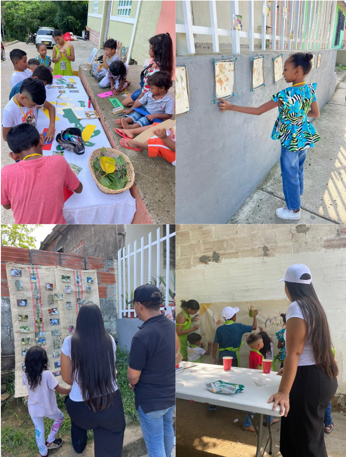
Figura 24. Registro 2, Día de la exposición