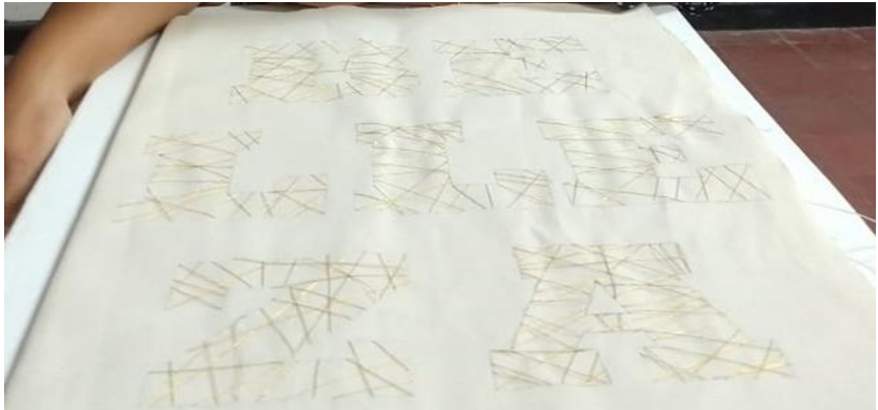
Figura 6. Detalle Propuesta artística Belleza (2019).

En el año 2020 mi obra Virus De La Indiferencia , se acerca más a la acción frente a la problemática desde la gráfica, y así surge una propuesta visual que consistió en la elaboración de estenciles con imágenes alusivas al abandono animal como una forma más de maltrato. La fácil reproductividad de la técnica permitía abarcar varias paredes o sitios de acopio para botaderos masivos de animales domésticos a lo largo de la ciudad.