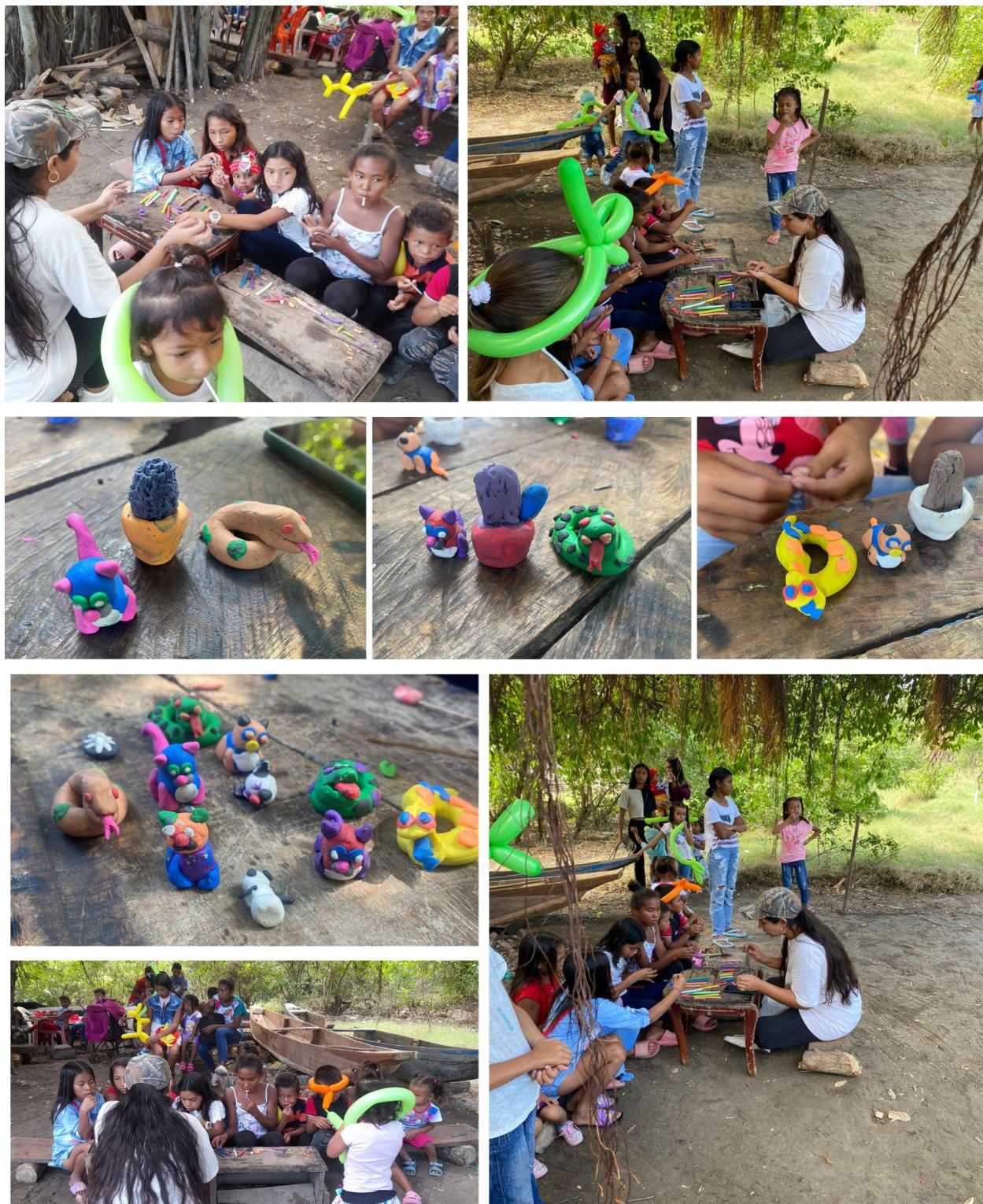
Figura 4. Registro actividades con la población de Palermo (2023).