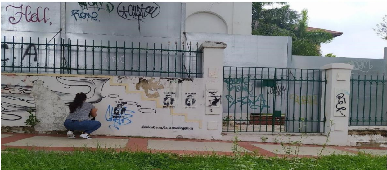
Figura 7. Registro, obra y acción Virus de la indiferencia (2019).