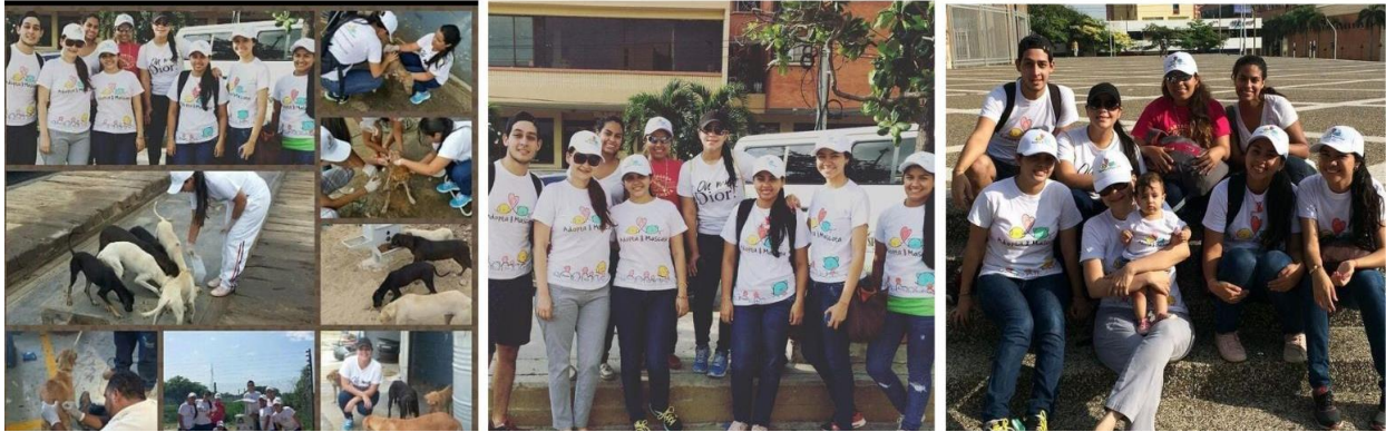
Registro 2. Registro de integrantes de la Fundación Adopta Una Mascota (2015).

Esta experiencia y mi interés innato por los animales me llevó a ocupar espacios relacionados con el propio cuidado animal de forma más activa y apasionada, pero además más consciente, adquiriendo información y ampliando mi visión sobre esta problemática. Así en el año 2022 me uno como voluntaria al Proyecto Zoorpresa Silvestre, en el que me voy adentrando mucho más en la experiencia directa del cuidado de fauna silvestre víctima del tráfico ilegal. Es allí donde desde la adecuación de espacios y el rol de guía, simultáneo al cuidado animal, voy comprendiendo de manera más clara, la importancia de establecer con el público herramientas pedagógicas y espacios de reflexión frente a la situación del cuidado con los animales. Este espacio no solo es construido desde el discurso, sino a través del trabajo manual con técnicas como el bricolage entre otras, donde se buscaban espacios de inmersión con animales domésticos para entender su condición, asumir en lo posible conductas adecuadas para su correcto cuidado y ver la actividad, como una posibilidad para alejarlos del fenómeno del “ mascotismo ” de fauna silvestre.