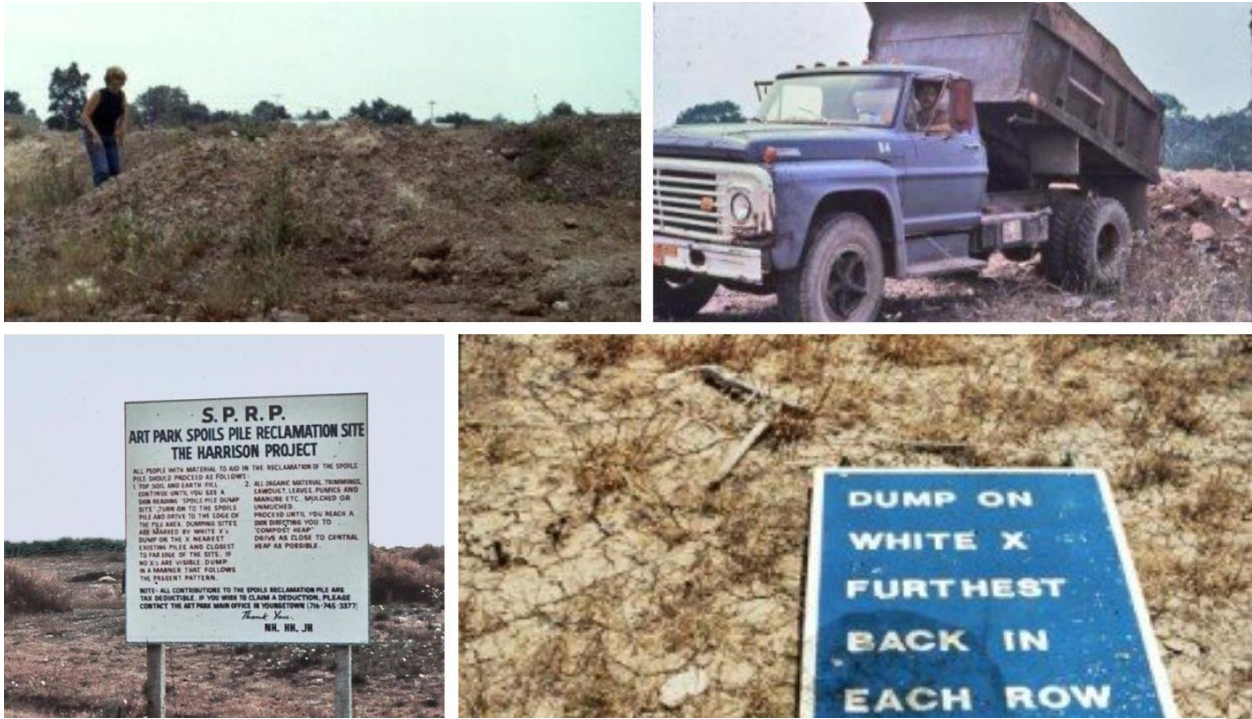
Figura 11. Art Park.