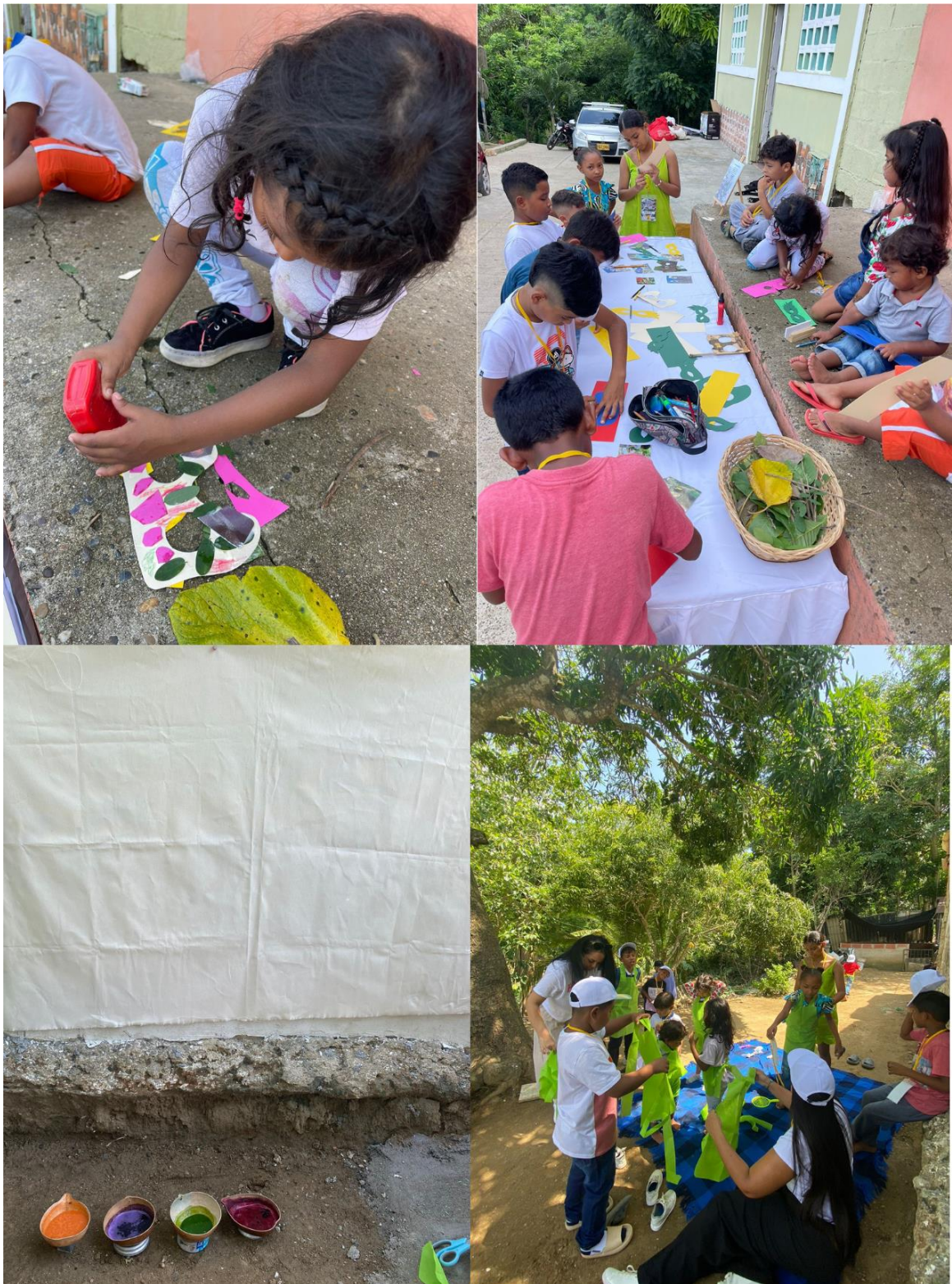
Figura 26. Registro 4, Día de la exposición