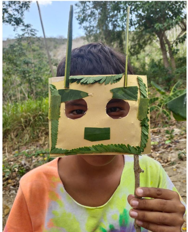
Figura 22. Registro 2, Yo Naturaleza.