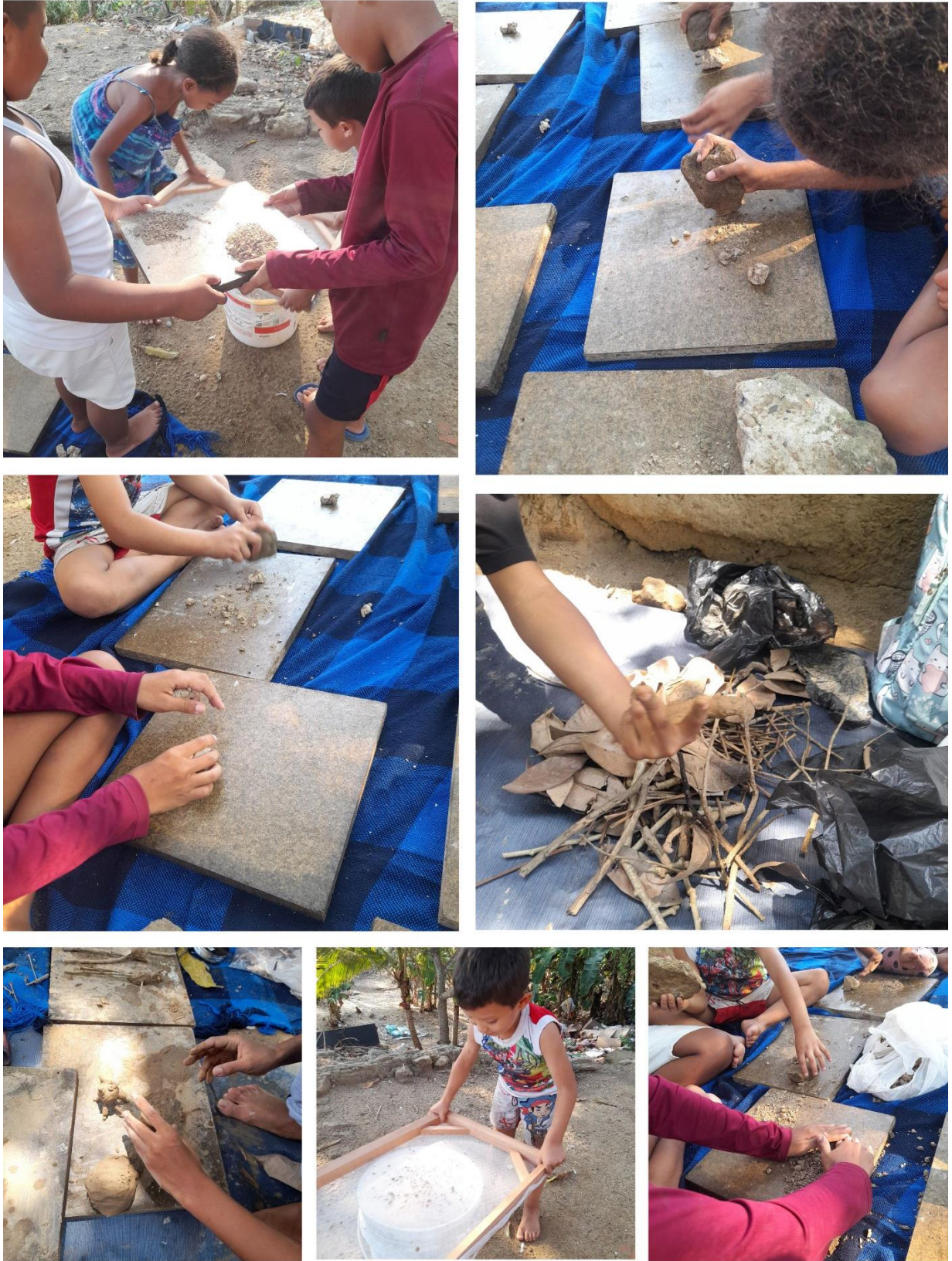
Figura 15. Registro 1. Actividades del Taller Lo Ancestral.