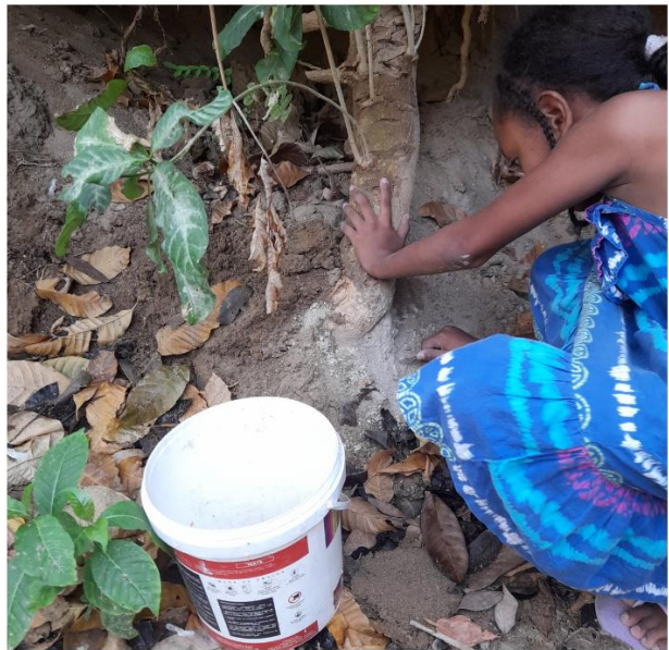
Figura 16. Registro 2. Taller Lo Ancestral.