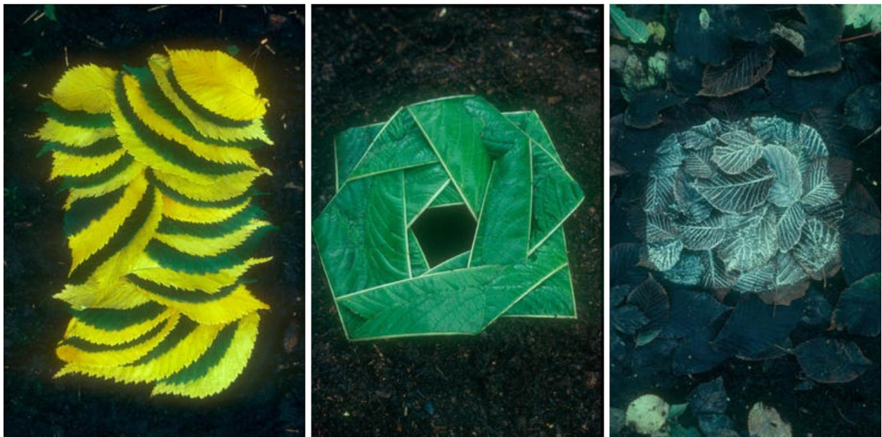
Figura 13. Obras Andy Goldsworthy.

Otro trabajo importante para destacar dentro de una práctica que interioriza las relaciones con el entorno natural y hace uso de materiales propiamente del espacio sin aditivos ni manufacturados, es el trabajo de Andy Goldsworthy. En Leaf Lines (Reino Unido, 1987), se presenta un conjunto de obras efímeras, en las que el artista recolecta las hojas de diferentes colores y texturas y las coloca cuidadosamente en el suelo siguiendo una línea trazada, las cuales se van desintegrando y marchitando con el paso del tiempo por su exposición al sol, la lluvia y