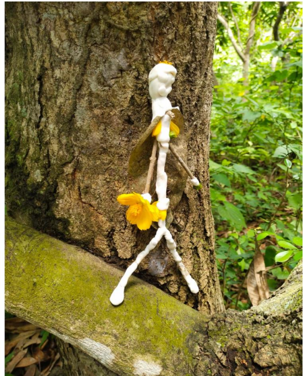
Figura 17. Resultados Registro gráfico 1, Taller Yo Naturaleza.