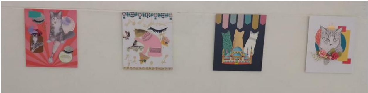
Figura 5. Registro de obra La vida de Pepe (2019).

También en mi ejercicio artístico y académico, he demostrado abiertamente mi interés por la vida animal y comienzo con la obra titulada La Vida De Pepe (2019); una obra que surge a partir de la convivencia con Pepe, un gato discapacitado víctima del maltrato animal que con su movilidad limitada y su intento por resolver sus necesidades desde su condición, me motivó a dialogar sobre aquellas heridas y cicatrices que en lugar de ser escondidas deben ser resaltadas; por lo que empleo la técnica del kintsugi aplicada al collage.